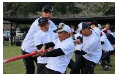
力の限り綱を引きます。