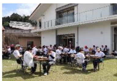
みんなで楽しいランチタイム