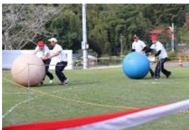
呼吸を合わせてゴールを目指せ!