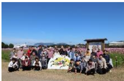
朝倉の麒麟ビール園でハイポーズ ☺