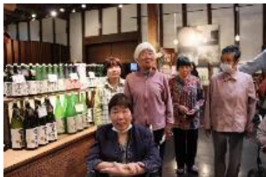
造り酒屋できき酒ですか? ☺