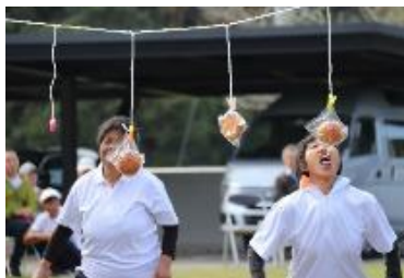
もっと口を開けて