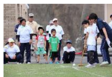
ご家族も一緒にゲートボール