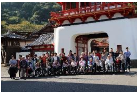
武雄温泉シンボルの楼門前で記念撮影