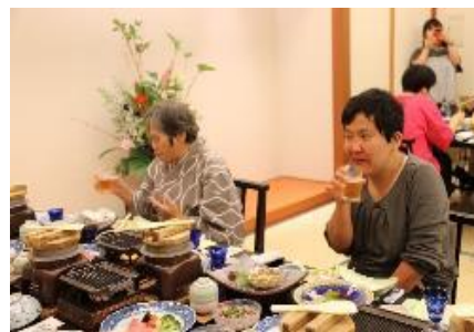
ホテルでの食事。ビールで乾杯。