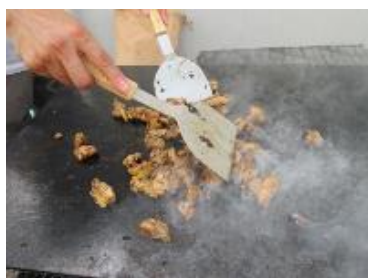
慣れた手つきで焼き上げました。