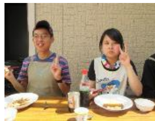
言う事なし。ピース ♪