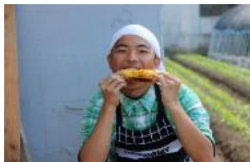
香ばしく焼けて「マイウ～」