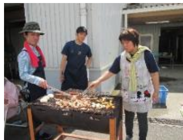
「もう少しで焼けるから待っててね。」