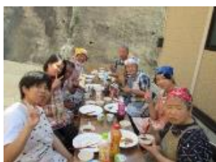
青空の下でのBBQ～最高～

毎年9月の調理実習は、バーベキューとなっています。 写真を見ただけで説明はいらないと思います。