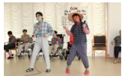
職員による出し物です。