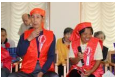
赤いちゃんちゃんこは、恥ずかしい

敬老会の様子を、ご覧になってください。皆さんまだまだ高齢者にはほど遠いと思いませんか。