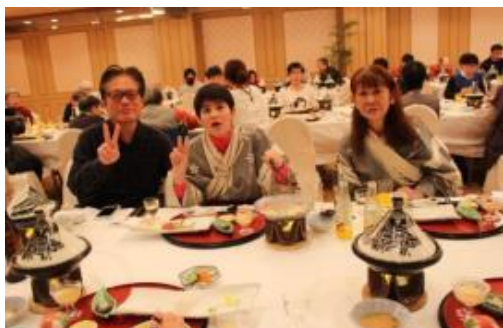
(豪華な食事にピース。)

最後までげや病気などなく元気に楽しい旅は終わりました。次回の旅行には、より多くの方が参加されることを願っております。