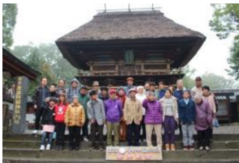
(国宝 青井阿蘇神社)